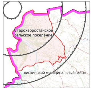
Зона наблюдения АЭС